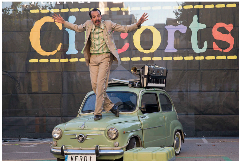
Espectacle de l'edició anterior del Circorts

Com cada any, durant tres dies, les pistes de circ del carrer Benavent i de la plaça de les Ceràmiques Vicens es tornaran a omplir de vida, somriures i art circense.