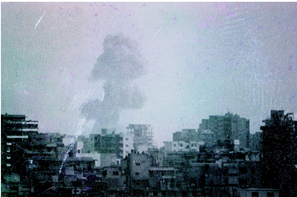
The Atlas Group / Walid Raad

We decided to let them say, "We are convinced" twice , 2005 Colección Fundación ARCO. Depósito CA2M