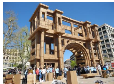
Construccions de cartró d'Olivier Grossetête