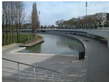
Parc de la Trinitat