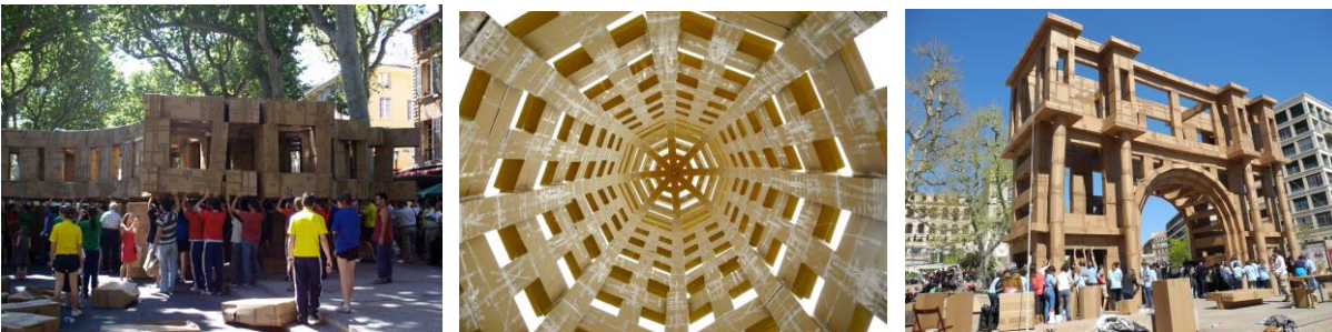
Les constructions en carton d'Olivier Grossetête

Le public de la fête sera de plus invité à participer et à être le protagoniste des différentes propositions artistiques de la fête, comme par exemple les grandes constructions éphémères en carton de l'artiste français Olivier Grossetête au Parc de la Ciutadella.