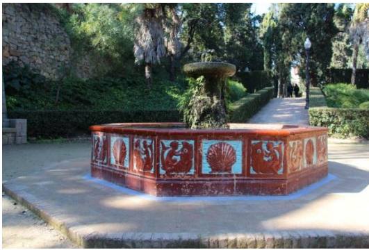
Vista actual dels Jardins de Laribal. Roserar de la Colla de l'Arròs

En aquest espai Rubió i Tudurí i Forestier introdueixen un nou estil de jardí d'arrel mediterrània que combina la vegetació autòctona amb nous recursos com la ceràmica o l'aigua.