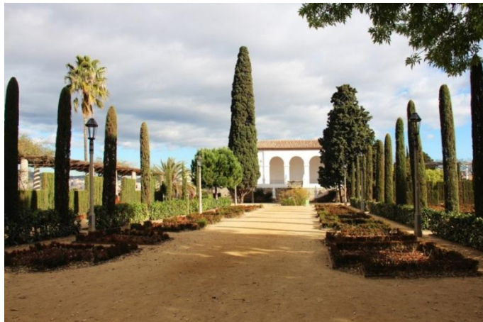
El Roserar Amargós (Jardins del Teatre Grec)

Els actuals Jardins del Teatre Grec són alguns dels espais més destacats del llegat de Forestier a la ciutat. Aquest espai es va convertir en el roserar més extens de Barcelona.