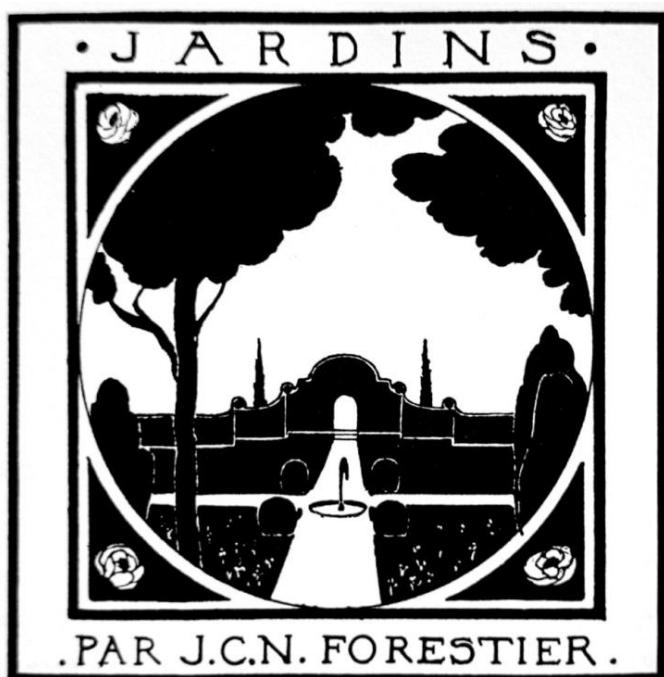
Signatura JCN Forestier

Forestier de la seva banda va dissenyar d'altres projectes en solitari com ara la Font de la Budellera, el Jardí de la central tèrmica de Sant Adrià del Besòs o el jardí privat per al marquès d'Alella al carrer Muntaner.