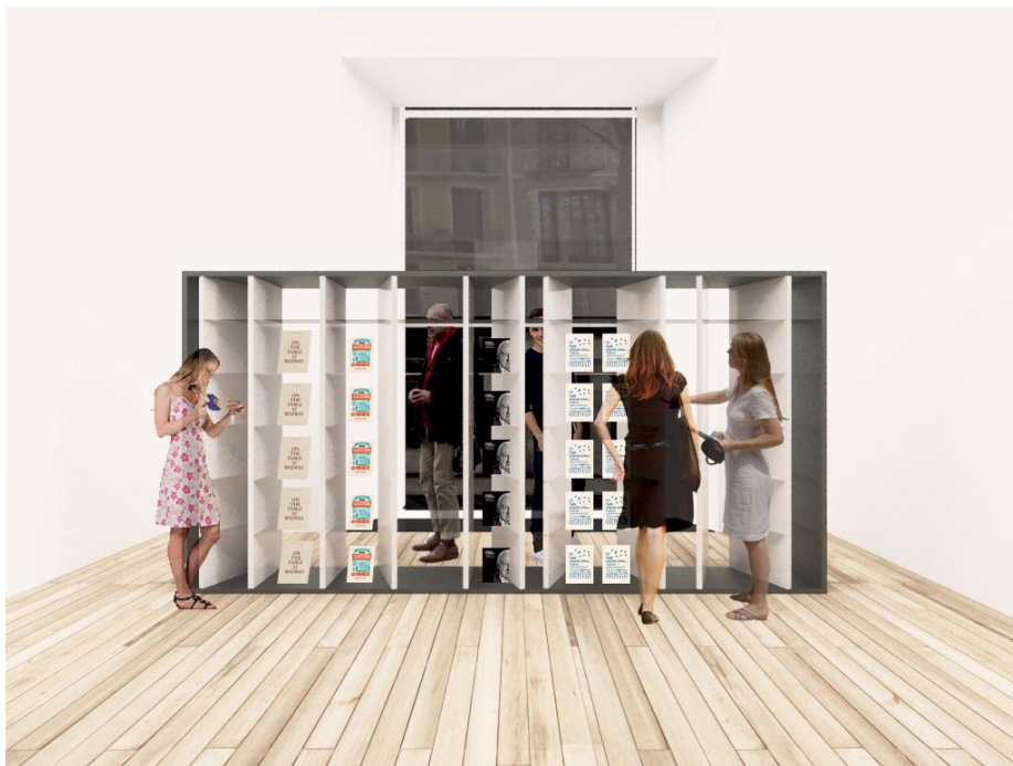
Imatges virtuals del resultat de la intervenció de AV62 Arquitectes