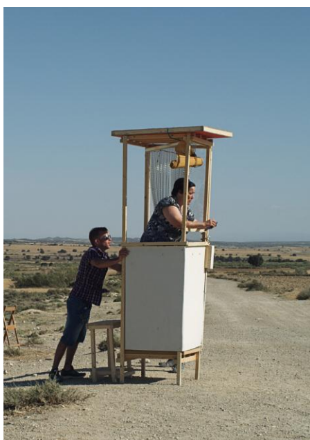
Jordi Colomer. PROHIBIDO CANTAR / NO SINGING ( Obra didáctica sobre la fundación de una ciudad paradisíaca ). 2012.

En España, las ciudades para el entretenimiento tienen una dilatada trayectoria. Dos proyectos emblemáticos, ambos fallidos, fueron Gran Escala y Eurovegas. La fundación de Eurofarlete, la ficticia ciudad paradisíaca que propone Jordi Colomer, acontece en el territorio desértico de Los Monegros previsto para Gran Escala. Con fidelidad al texto de Brecht, unos personajes irrumpen en la nada e inician la construcción de una ciudad del juego. Apenas alcanzan a levantar el garito de entrada y unos precarios escenarios, pero es suficiente para evocar el espíritu de Mahagonny. Mediante citas literales del texto de Brecht y utilizando las técnicas de distanciamiento que propuso el dramaturgo alemán para garantizar un teatro pedagógico, Jordi Colomer propone un singular remake del ascenso y de la caída de Eurofarlete.