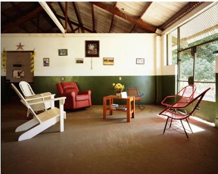
Dan Dubowitz. Fordlandia: Henry Ford's Lost City in the Jungle . Commercial Ford / Canteen. 2012