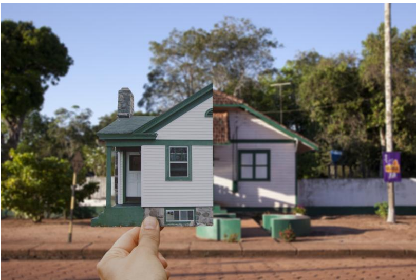
Clarissa Tossin. When two places look alike . 2012