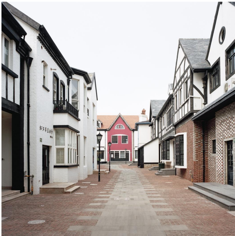
David Wyatt. Thames Town I. 2008