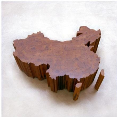
Mapa de China, 2004 © Ai Weiwei