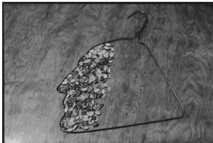
Fotografías de Nueva York, 1983-1993. Perfil de Duchamp, semillas de girasol, 1983

La exposición se inicia con New York Photographs (1983-1993), la crónica fotográfica que hizo Ai Weiwei de su estancia de una década en Nueva York, adonde viajó como integrante de una generación de artistas chinos que decidieron abandonar su país en busca de libertad de expresión y de una escena artística y cultural estimulante y dinámica que les permitiese iniciar una carrera prometedora. Ai Weiwei, uno de los miembros más activos de esta diáspora china, entró en contacto con la obra de algunos de los que serían sus referentes más destacados, como los artistas Marcel Duchamp y Andy Warhol, y al mismo tiempo conoció a intelectuales como el poeta Allen Ginsberg, el fotógrafo Robert Frank y maestros como el pintor Sean Scully. De este momento son algunos de sus primeros autorretratos, una práctica que se mantendrá constante hasta hoy, a la vez que aparecen los primeros indicios de una mirada que busca apropiarse del contexto para captar y transmitir la energía en tensión y el estado de conflicto que configuran el espacio urbano. Y así también lo hace a través de la apropiación crítica e irónica de objetos cuya forma y funcionalidad trastorna, como es el caso de Suitcase for Bachelor (1983), Hanging Man (1987), One-Man-Shoe (1987) y Château Lafite (1987), con una fuerte huella duchampiana.