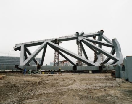
Fotografías del Estadio Nacional, 2014 Estadio Nacional núm. 2 (4-4-2006)