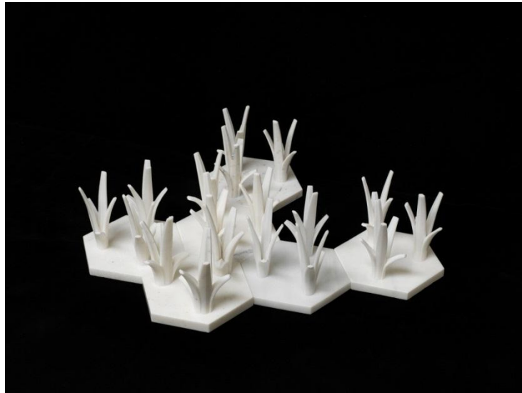
Cao, 2014 © Ai Weiwei

Conectando las dos series fotográficas se encuentra Cao (2014), en una sala empapelada con un diseño realizado por Ai Weiwei a partir de un gesto que se ha convertido en icono de protesta y provocación reconocido en todo el mundo: el brazo con el dedo corazón levantado que el artista blandía a menudo delante de los símbolos del poder establecido. La combinación entre la instalación de hierba realizada en mármol y el gesto repetido parte de una yuxtaposición o juego de palabras habitual en la obra de Ai: fake y fuck . Pronunciada como si fuera una transcripción del chino, fake suena como fuck pronunciada en inglés. Por otro lado, cao (en chino, 'hierba') es homófona de la palabra china equivalente al fuck inglés.