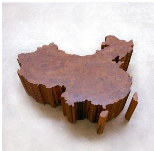
Mapa de China, 2004 © Ai Weiwei

En respuesta a la invitación de la Tate Modern en 2010 para realizar una instalación en el Turbine Hall, Ai Weiwei llenó la sala con 150 toneladas de semillas de girasol de porcelana, 100 millones de piezas hechas manualmente por centenares de artesanos de Jingdezhen, una ciudad conocida como “la capital de la porcelana” milenaria en China. Las semillas, con una fuerte carga simbólica que remite a la Revolución Cultural de Mao Zedong, configuraban un misterioso océano sobre el que se invitaba a andar, en una contraposición audaz de la identidad y la experiencia individual y la pertenencia colectiva.