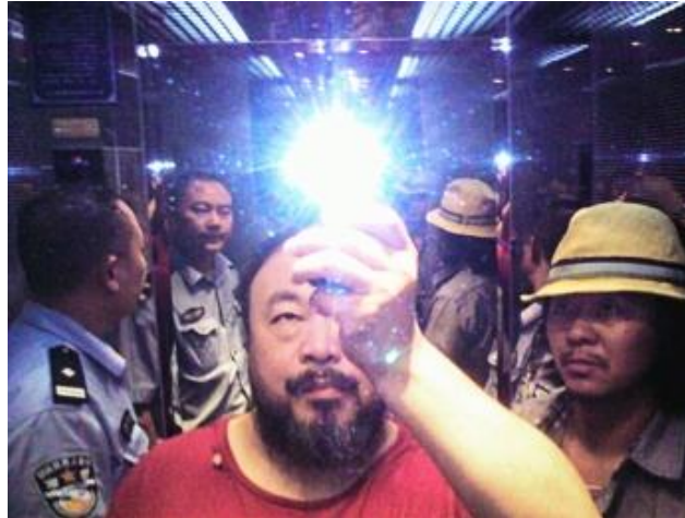
Iluminación 2009 © Ai Weiwei

Sin embargo, el artista ya había catado la privación de libertad cuando cumplió el arresto domiciliario unos meses antes, después de decidir organizar una fiesta a raíz del anuncio de la demolición de su estudio en Shanghai por parte del mismo gobierno que le había invitado a construirlo. Aunque sin su presencia, la celebración se llevó a cabo igualmente y congregó a centenares de personas que ignoraron la prohibición y las intimidaciones del gobierno. Durante la fiesta se comieron los cangrejos de río que había encargado el artista, en un nuevo gesto provocativo, puesto que el término chino que corresponde a cangrejo (河蟹 héxiè ) remite a la palabra armonía , uno de los pilares de la doctrina comunista y eufemismo utilizado con frecuencia por el aparato para referirse a la aplicación de la censura. Se sirvieron 10.000 cangrejos, una cifra habitual en los eslóganes maoístas, en proclamas como “¡El presidente Mao vivirá 10.000 años!”. Con relación a estos hechos, se muestran Shanghai Studio (2010), Shanghai Studio Demolition (2011), He Xie (2011), Malu Studio Shanghai (2011) y The Crab House (2012).