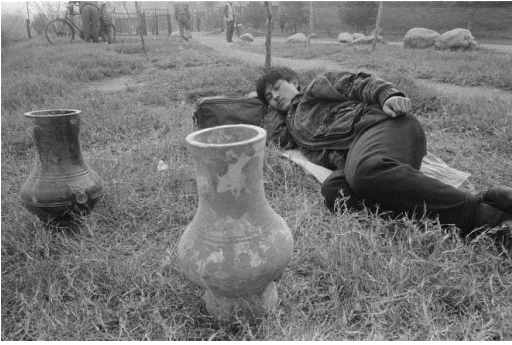
Fotografías de Pekín, 1993-2001 Urna de la dinastía Han en venta fuera de la muralla de la ciudad de Xi'an. 1995