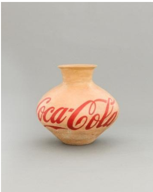
Jarrón de Coca Cola, 1994 © Ai Weiwei