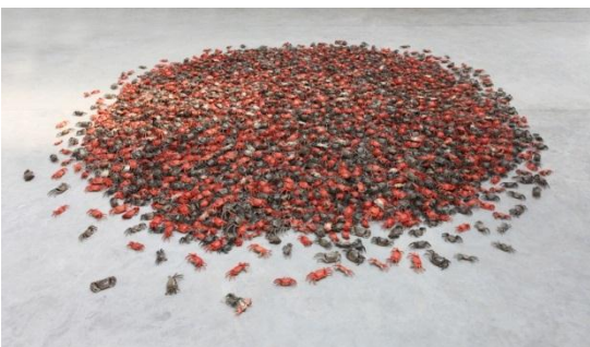
He Xie, 2011 © Ai Weiwei