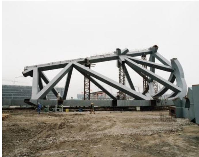
Fotografías del Estadio Nacional, 2014 Estadio Nacional núm. 2 (4-4-2006) © Ai Weiwei

La tensión entre tradición y contemporaneidad y la mirada afilada de Ai Weiwei a la transformación de China es patente también en obras como Souvenir from Beijing (2002) y Provisional Landscape (2002-2008), en las que destrucción y construcción quedan solapadas en un mismo plano, siendo inseparables el pasado del presente hasta el punto de evaporarse uno en el otro. Asimismo, los contrarios se intercambian en National Stadium (2014), una serie fotográfica sobre la construcción del estadio olímpico que Ai Weiwei contribuyó a diseñar junto con los arquitectos suizos Herzog & de Meuron en 2008, en el que la forma exterior no es nada más que la estructura de apoyo del edificio, de modo que el interior y el exterior han sido intercambiados.