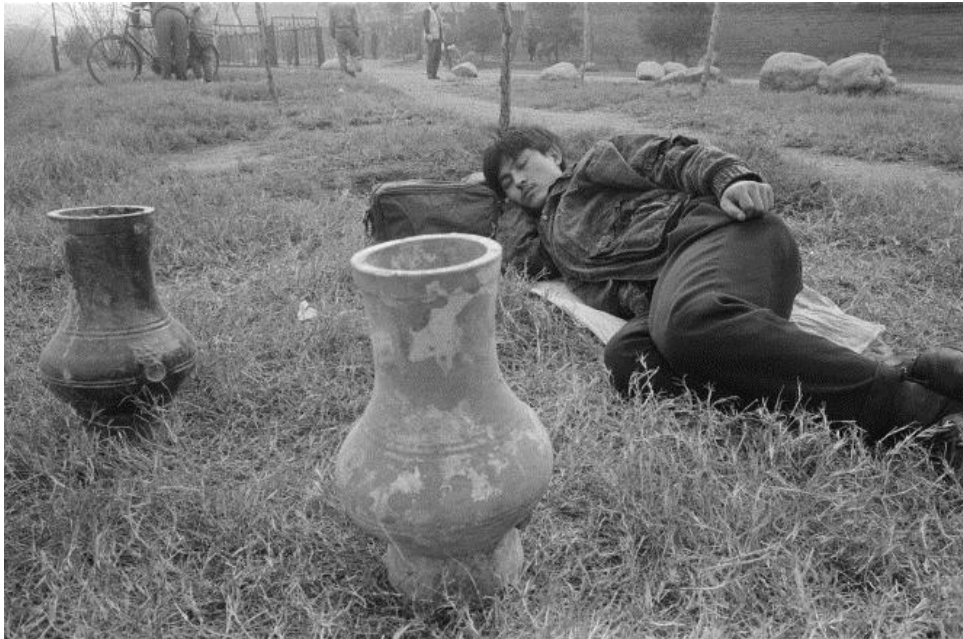
Fotografías de Pekín, 1993-2001