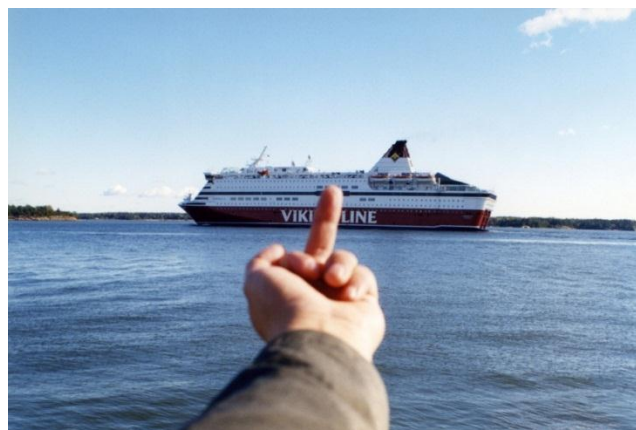
Estudio de la perspectiva, 1995-2011, 2014 © Ai Weiwei

Ocupando todo el corredor que conecta las dos alas del Palacio de La Virreina, encontramos Study of Perspective, 1995-2011 (2014), una de las series más conocidas de Ai Weiwei. Realizada entre 1995 y 2011 en ciudades de todo el mundo. Mirada, gesto y subversión coinciden en acciones que se convertirán en imágenes icono del mismo Ai Weiwei y de su actitud osada y provocadora ante los símbolos del Poder. Study of Perspective, 1995-2011 es sin duda su propio avatar, un manifiesto y manual de instrucciones para ejercer una mirada, más que lúcida, desafiante: la mirada de la disidencia.