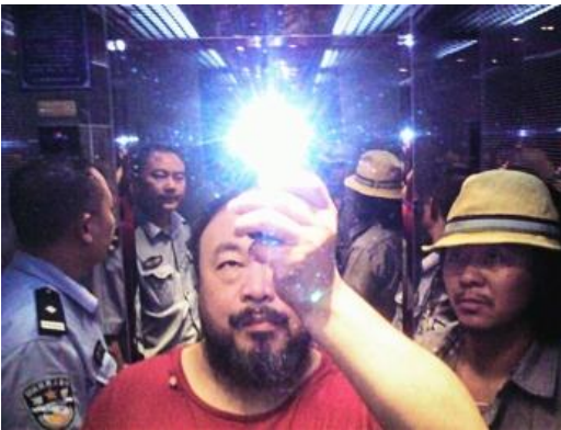
Iluminación , 2009 © Ai Weiwei