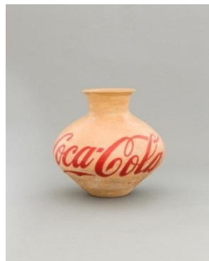
Jarrón de Coca Cola, 1994 © Ai Weiwei

Conectando las dos series fotográficas se encuentra Cao (2014), en una sala empapelada con un diseño realizado por Ai Weiwei a partir de un gesto que se ha convertido en icono de protesta y provocación reconocido en todo el mundo: el brazo con el dedo corazón levantado que el artista blandía a menudo delante de los símbolos del poder establecido. La combinación entre la instalación de hierba realizada en mármol y el gesto repetido parte de una yuxtaposición o juego de palabras habitual en la obra de Ai: fake y fuck . Pronunciada como si fuera una transcripción del chino, fake suena como fuck pronunciada en inglés. Por otro lado, cao (en chino, 'hierba') es homófona de la palabra china equivalente al fuck inglés.