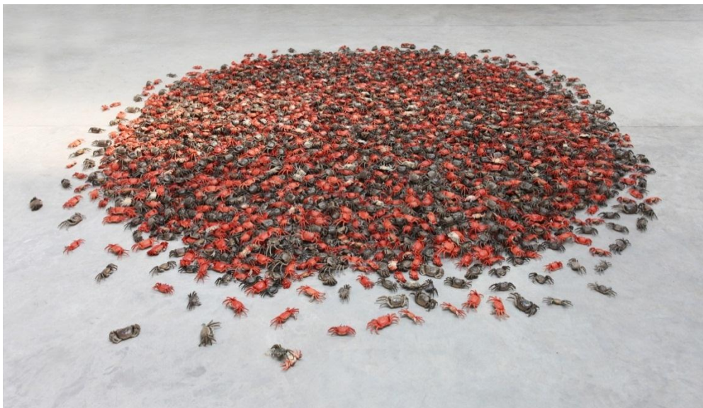
He Xie , 2011 © Ai Weiwei

Sin embargo, el artista ya había catado la privación de libertad cuando cumplió el arresto domiciliario unos meses antes, después de decidir organizar una fiesta a raíz del anuncio de la demolición de su estudio en Shanghai por parte del mismo gobierno que le había invitado a construirlo. Aunque sin su presencia, la celebración se llevó a cabo igualmente y congregó a centenares de personas que ignoraron la prohibición y las intimidaciones del gobierno. Durante la fiesta se comieron los cangrejos de río que había encargado el artista, en un nuevo gesto provocativo, puesto que el término chino que corresponde a cangrejo (河蟹 héxiè ) remite a la palabra armonía , uno de los pilares de la doctrina comunista y eufemismo utilizado con frecuencia por el aparato para referirse a la aplicación de la censura. Se sirvieron 10.000 cangrejos, una cifra habitual en los eslóganes maoístas, en proclamas como “¡El presidente Mao vivirá 10.000 años!”. Con relación a estos hechos, se muestran Shanghai Studio (2010), Shanghai Studio Demolition (2011), He Xie (2011), Malu Studio Shanghai (2011) y The Crab House (2012).