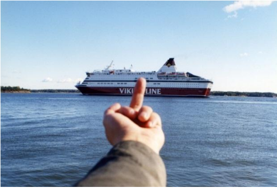
Estudio de la perspectiva, 1995-2011, 2014