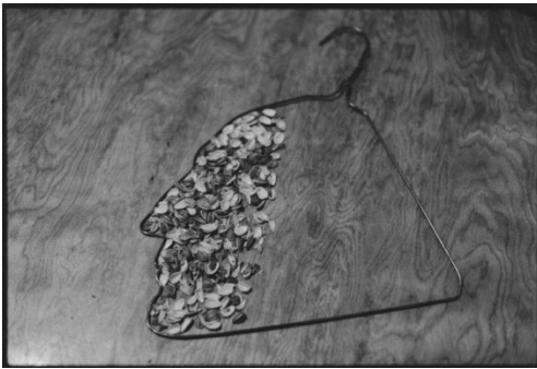
Fotografías de Nueva York, 1983-1993. Perfil de Duchamp, semillas de girasol, 1983

https://eicub.net/?grup=Virreinacentredelaimatge