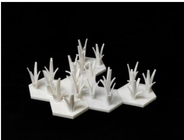
Cao, 2014 © Ai Weiwei