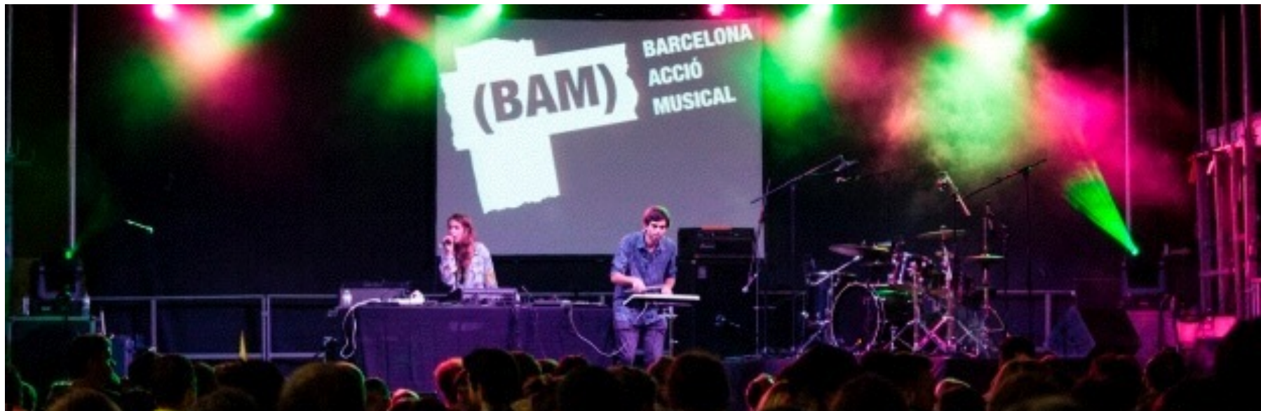
BAM 2014

I la intenció continua sent mantenir aquesta filosofia. Apropar a la ciutat noves propostes musicals poc habituals, no massa conegudes per una gran majoria, i intentar que la ciutat visqui una experiència nova i excitant. Seguir nodrint aquesta marca BAM, identificada per molts com a marca de qualitat, per mostrar una diversitat allunyada de tendències i modes. Enguany rebrem noves propostes que sorgeixen dels estils musicals més globalitzats, com el pop, rock, electrònica... Així com d'altres més d'arrel i folklòriques que sorgeixen al voltant del món. Mirarem de donar l'espai que creiem que es mereix la música, i que la gent visqui una experiència única.